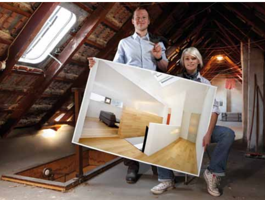
Mit Multi-Komfort werden Wohnträume wahr.

Bauherren und Modernisierer wünschen sich die ideale Wohnumgebung. Sie planen für die Zukunft und wollen dauerhaft die richtige Entscheidung treffen. Multi-Komfort erfüllt diese Anforderung und bietet Lösungen für maximale Wohn- und Lebensqualität, ein optimales Raumklima sowie hervorragenden Schutz von Heim, Umwelt und Familie – auch vor hohen Energiekosten.