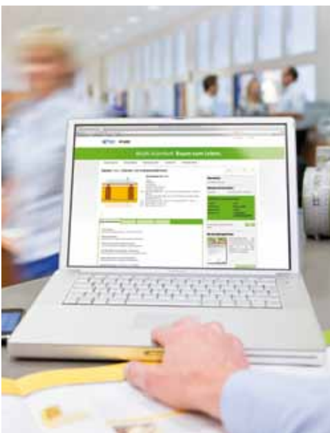
Bauteilberater für Multi-Komfort-Lösungen

Mit dem Bauteilberater lassen sich Kundenwünsche direkt aufgreifen und mit nur wenigen Mausklicks in konkrete, auf Haltbarkeit und Wirkung geprüfte Konstruktionen umsetzen. Einfach das Wunschprofil des Kunden sowie das betreffende Bauteil eingeben und die passende Lösung auswählen. So erhält man im Handumdrehen alle benötigten Planungsdaten – sowie eine erweiterte Garantie für die Bauherren.